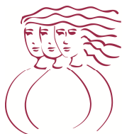
Table de concertation de Laval en condition féminine