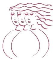
Table de concertation de Laval en condition féminine