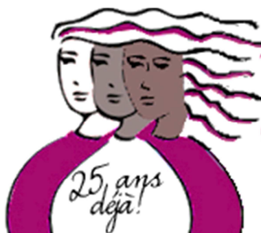
Table de concertation de Laval en condition féminine